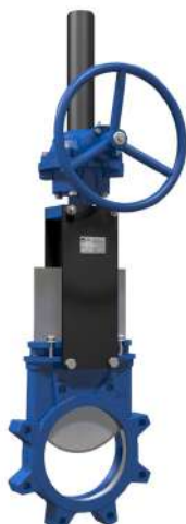
ΤΥΠΟΣ Α LUG