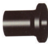
ΛΑΙΜΟΣ PE 100 PN16