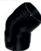
ΗΛΕΚΤΡΟΓΩΝΙΑ 45° PE 100 PN16