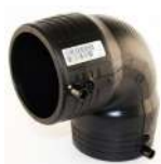
ΗΛΕΚΤΡΟΓΩΝΙΑ 90° PE 100 PN16