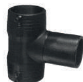
ΗΛΕΚΤΡΟΤΑΦ PE 100 PN16