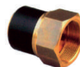
ΕΞΑΡΤ/ΜΑ ΜΕΤΑΒ.ΑΡΣ. PE 100 PN16