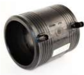
ΗΛΕΚΤΡΟΜΟΥΦΑ PE 100 PN16